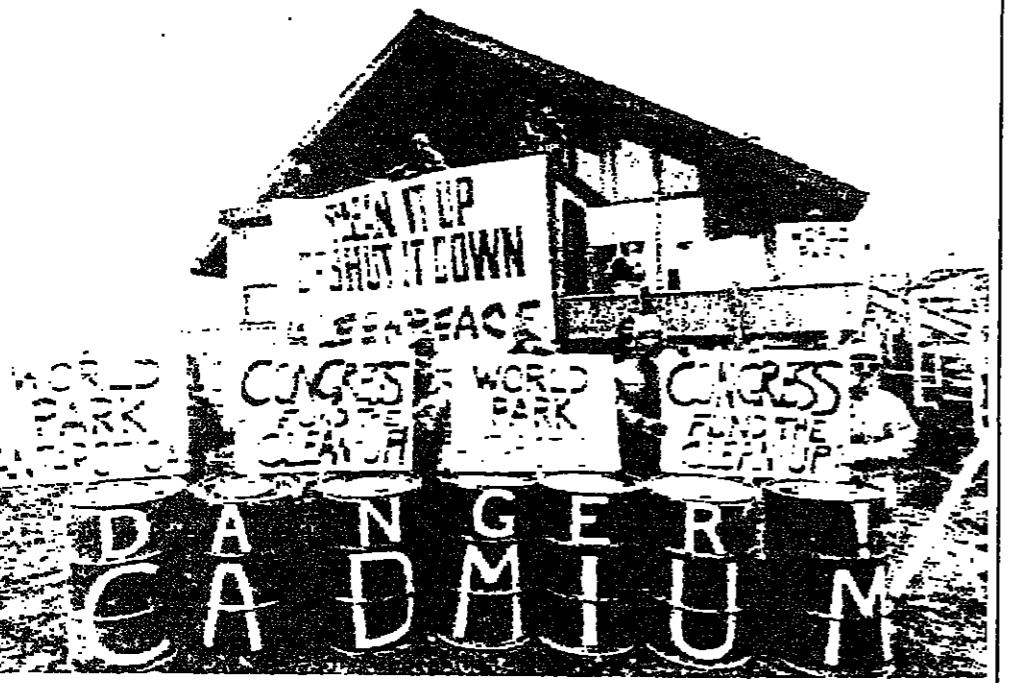
محتوياتها في مكان ما في المنطقة المتجمدة الجنوبية، وجاءوا بها الى امام مكاتب المحطة الاميركية التي تسير على عملية التفرغ.